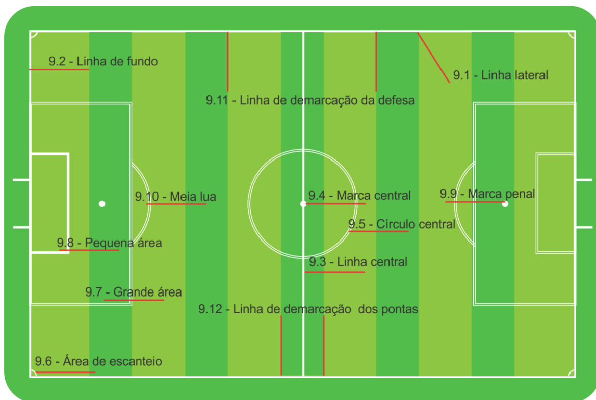
Marcações do Campo de Jogo - Figura Ilustrativa

9.12 - LINHA DE DEMARCAÇÃO DOS BOTÕES DAS PONTAS - Marcações paralelas, distantes 40 mm da Linha Central. Sua função é determinar a posição dos botões das pontas nas saídas de jogo com bola ao centro.